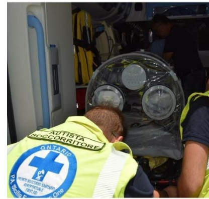
Personale Sanitario – Esercitazioni e Corsi