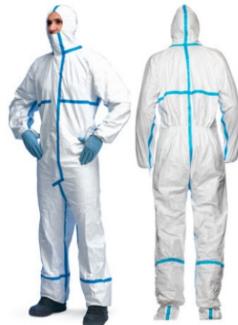
Tuta di protezione CAT. III Type 3/4/5/6

La sicurezza è garantita dal possesso di certificazioni specifiche che ne attestano: