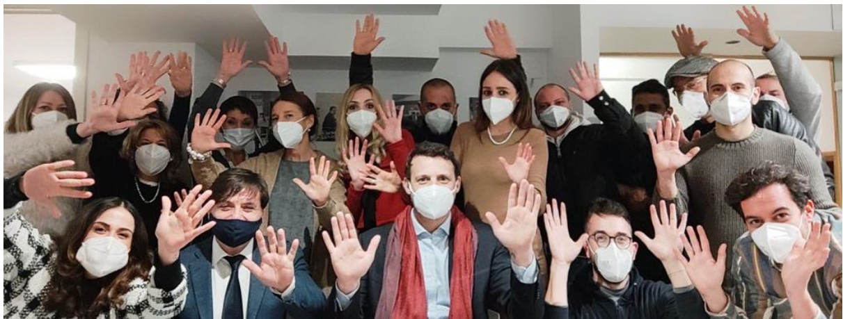
Team Ontario - Headquarter 2020

Organizzazione | Il team work della Ontario, grazie alla leadership aziendale, garantisce efficacia, efficienza e qualità; lavora in sinergia con procedure e "deadline" chiare e condivise.