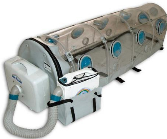
ISOARK N 36-2

Il dispositivo/camera di Biocontenimento è idoneo e compatibile con qualsiasi ambulanza per il trasporto via terra, ed è certificato per il trasporto all'interno di un velivolo di soccorso, sia esso elicottero o aereo.